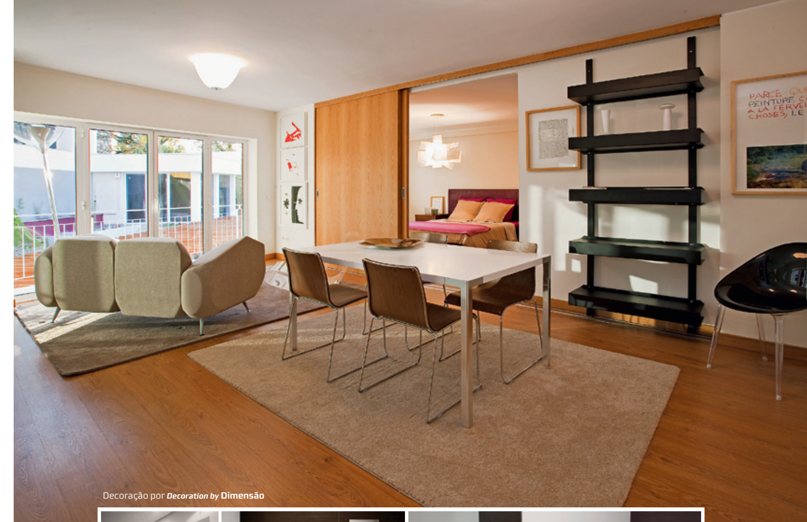
Decoração por Decoration by Dimensão

Located right in the historic centre of Viseu, Porta do Soar Residence is a condominium of unique versatility, marked by the comfort, modernity and functionality of its spaces. Built on a former building, it retains the façades, the area and some of the traditional architectural elements of old buildings in Viseu. With a built area of 5000m 2 , Porta do Soar Residence features three interconnected buildings housing 32 apartments – studios to three-bedroom