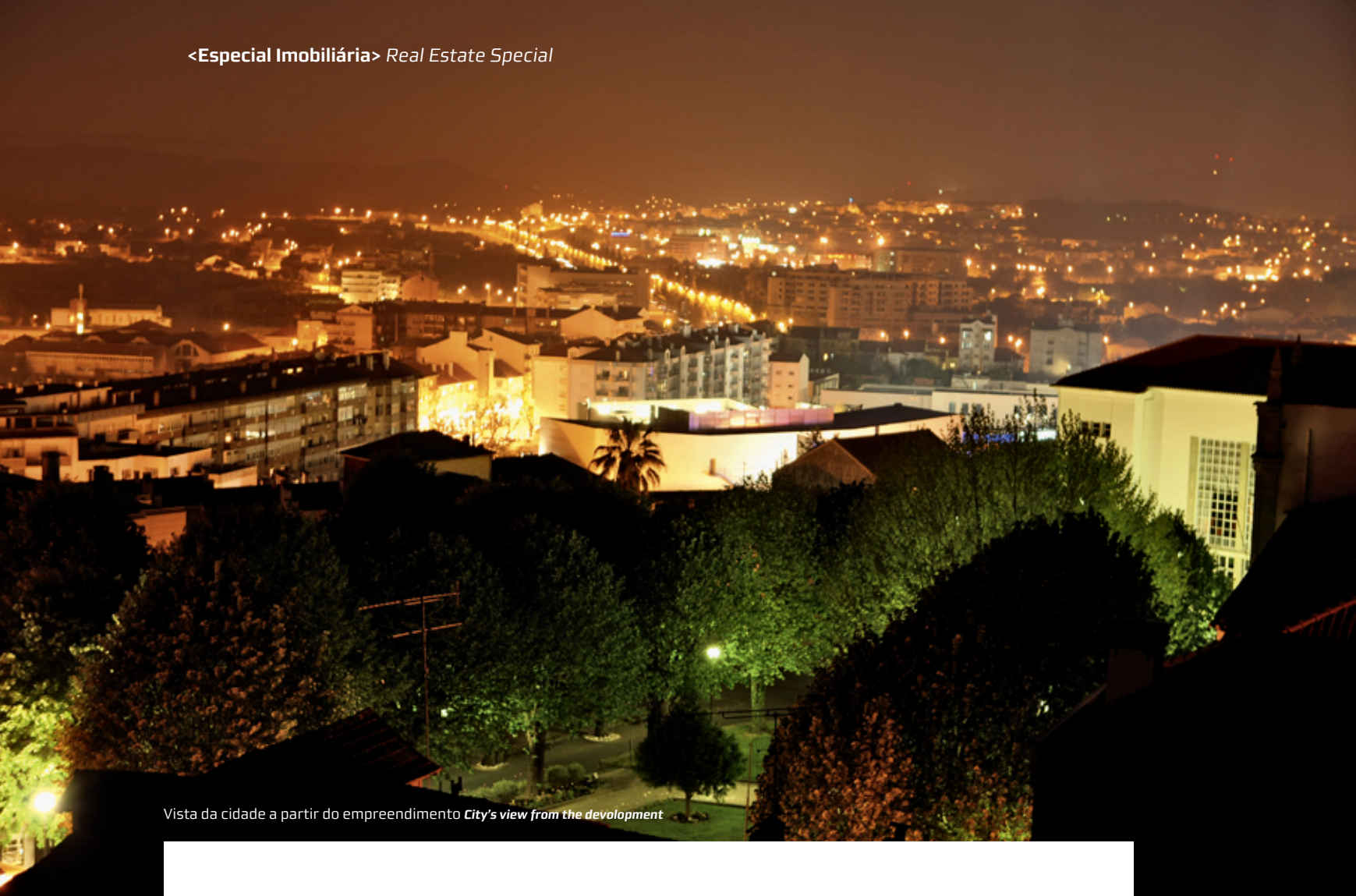
Vista da cidade a partir do empreendimento City's view from the development