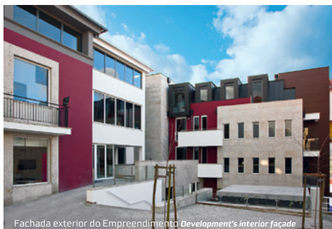
Fachada exterior do Empreendimento Development's interior façade

Planivis – Gestão e Planeamento de Empreitadas Rua D. Nuno Álvares Pereira, N.º 2 - 1.º | 3510 - 095 Viseu Tel. +351 232 425 042 | +351 232 432 700 planivis@planivis.pt | www.planivis.pt