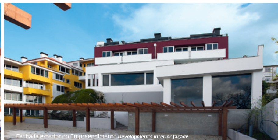
Fachada exterior do Empreendimento Development's interior façade